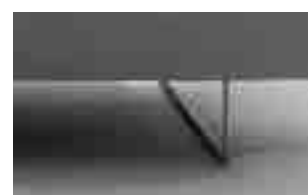
Piedi cromati G093 a slitta h. 17 cm